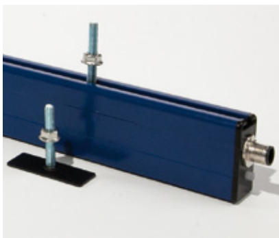
Montage durch verschiebbare Nutensteine M6 Mounting by sliding brackets M6

Hinweis: Technische Informationen s. Zubehör/Datenblatt Advice: Technical information s. Accessory/Datasheet